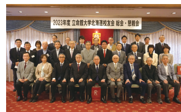
令和5年度総会参加者集合写真