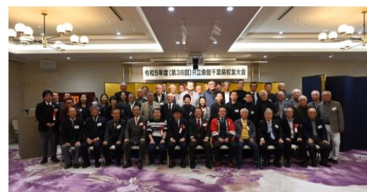
昨年の大会シーン