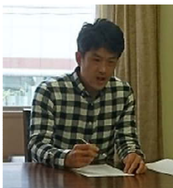
H27合格 北口 技術士 (上下水道部門)