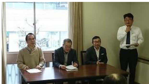
講師陣：日室幹事、大森会長、楠本副会長、太田幹事