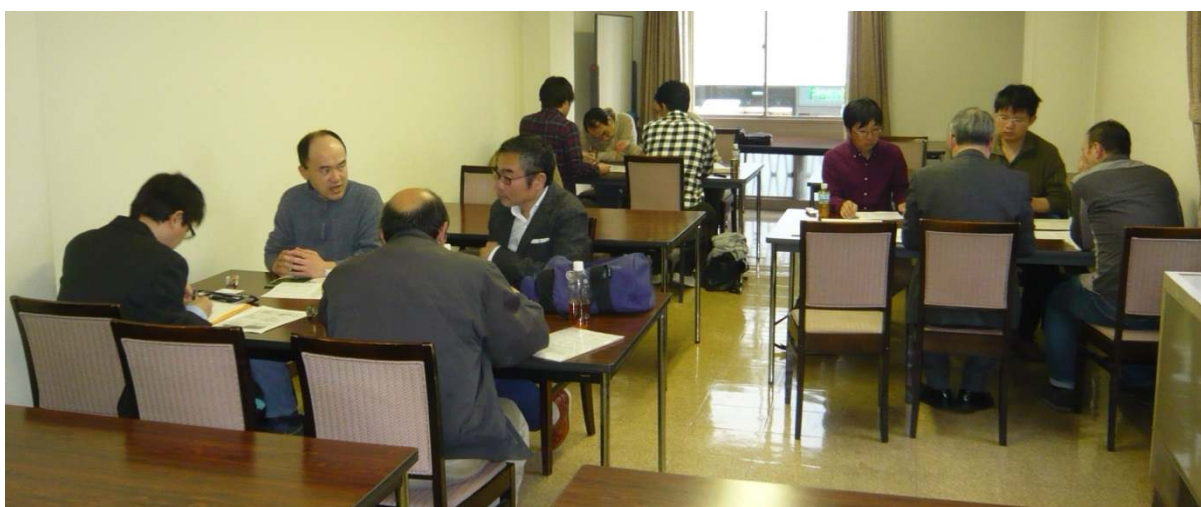
部門別に分かれて受験生と幹事の意見交換