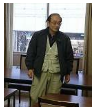
糸田川 幹事長からの激励