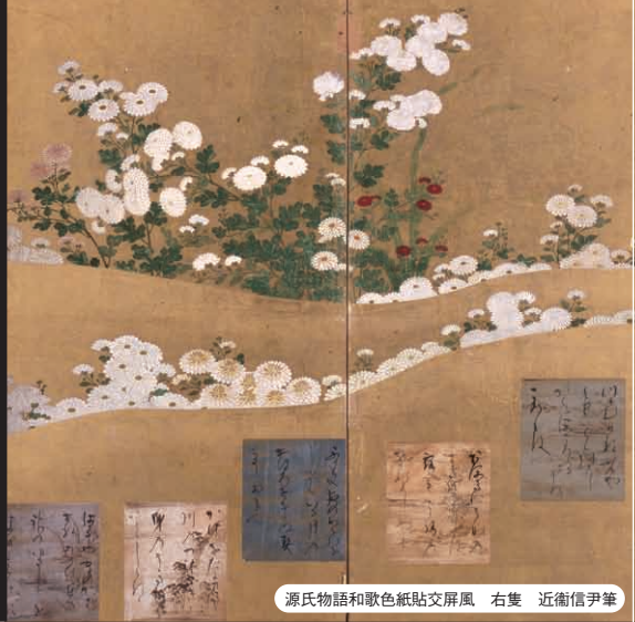
源氏物語和歌色紙貼交屏風 右隻 近衛信尹筆