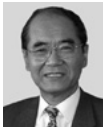
■コーディネーター 明日の京都 文化遺産プラットフォーム 会長 松浦 晃一郎 前ユネスコ事務局長