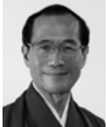
門川 大作 京都市長