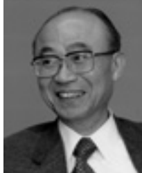
山折 哲雄 宗教学者